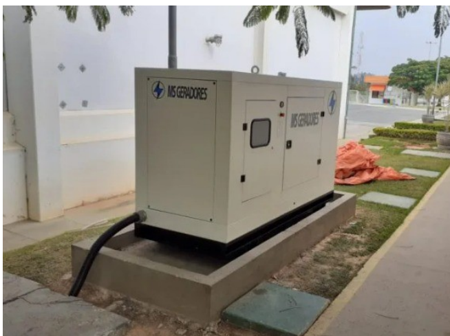
Modelo de caixa de contenção para geradores

impermeabilizadas e serem suficientes para conter quaisquer vazamentos que possam vir provenientes do equipamento.