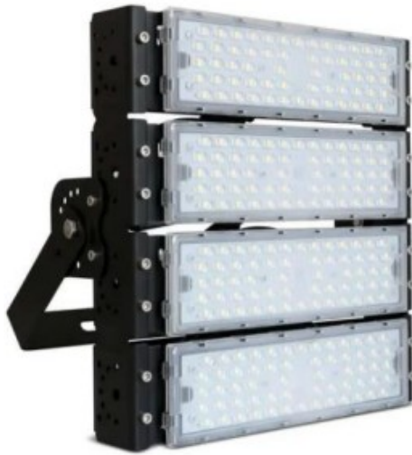
Sugestão de representação real