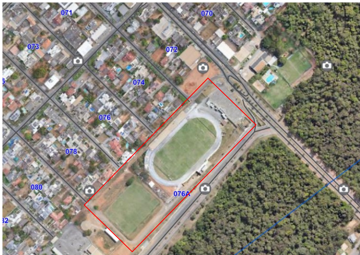
Geotecnologia 2026. Prefeitura de Lucas do Rio Verde.

A edificação a ser reformada está implantada na Avenida Goiás nº 566, Setor 03, Qd. 76, Lt. 0001 – Bairro Menino Deus na Cidade de Lucas do Rio Verde – MT.